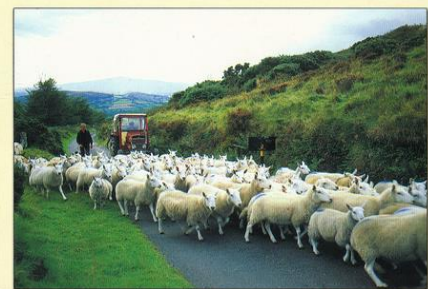
RUSH HOUR - IRELAND